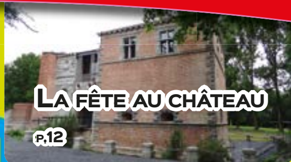
LA FÊTE AU CHÂTEAU

18 e édition des JOURNÉES DU PATRIMOINE EN WALLONIE