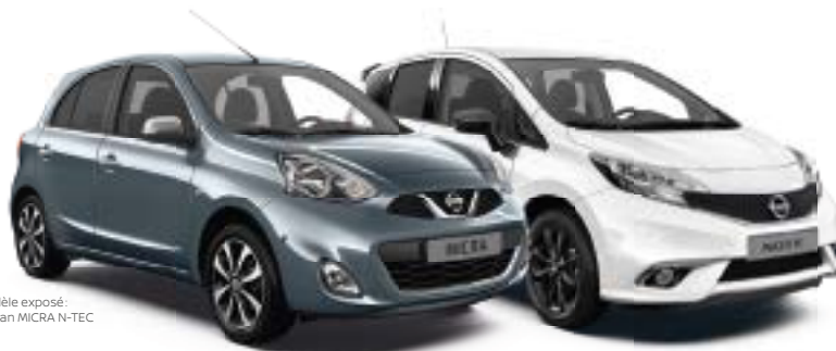
Modèle exposé: Nissan MICRA N-TEC